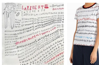
Oeuvre de Vonlanthen et t-shirt de Jason Wu

portant les motifs calligraphiques de cet artiste fribourgeois, analphabète, qui s’amuse à transgresser les codes de la typographie (photo ci-dessous).